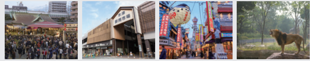
©(公財)大阪観光局 今宮戎神社 (ホテルより徒歩約7分) ©(公財)大阪観光局 大阪木津卸売市場 (ホテルより徒歩約5分) ©(公財)大阪観光局 新世界 (ホテルより徒歩約15分) ©(公財)大阪観光局 天王寺動物園 (ホテルより徒歩約15分)